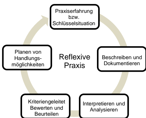
Abbildung 1: Reflexive Praxis in Anlehnung an Bräuer 2014

Das Portfoliokonzept auf dem Ansatz der reflexiven Praxis nach Gerd Bräuer veranschaulicht eine mögliche Vorgehensweise beim Verfassen einer Reflexion. (Bräuer 2014 1 , S.23 ff., siehe Abbildung). Dabei ist es elementar, dass Sie Ihre individuelle Entwicklung in den Blick nehmen, sich Ihre Stärken und Schwächen bewusstmachen und immer wieder die nächsten Schritte zur professionellen Weiterentwicklung planen. Daraus ergibt sich ein Aufbau von Kompetenzen, der mithilfe des Bräuer-Zirkels dokumentiert werden kann.